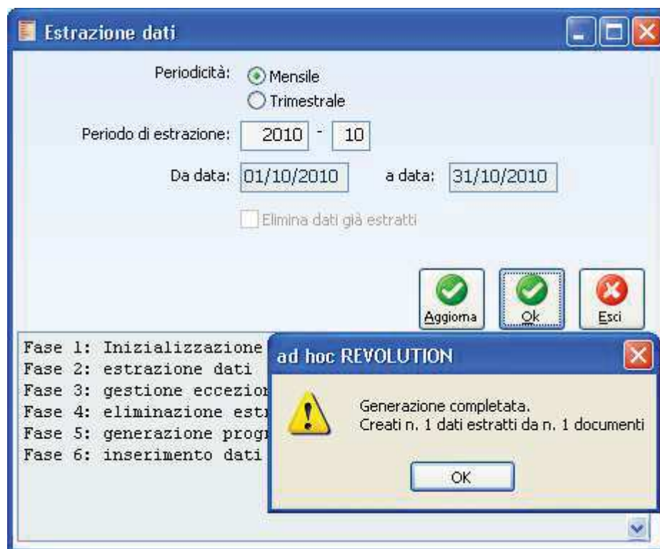
Fig. 3 - Estrazione dati

Nell'esempio sopra riportato, se effettuiamo un 'estrazione dati per il periodo mensile 12, in presenza della registrazione contabile sopra descritta, nei Dati estratti troveremo: